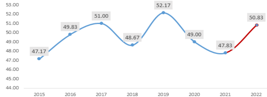
CAPAIAN DOMAIN IPP TAHUN 2020-2021 DAN EXERCISE 2022